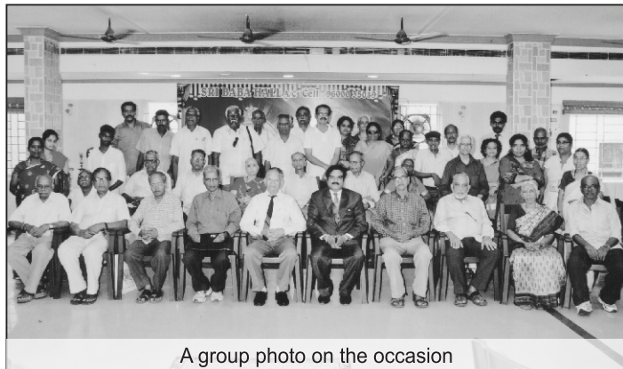
A group photo on the occasion