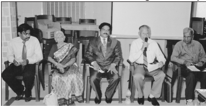
A view of the dais